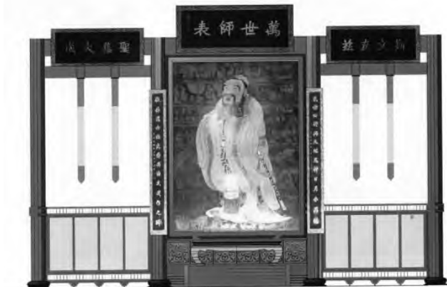
图4 悬垂旗及屏风(设计图)

在本文前述大成殿简介时可知,大成殿内部空间有着高、阔两大特点,因此在大成殿中堂设计时特地在“圣集大成”“斯文在兹”这两方匾额下分别增添两条悬垂旗用以消解大殿上层空间的空荡感觉,在悬垂旗的颜色选择上采用了符合大成殿整体配色的红黄相间的颜色组合方式。为了让悬挂在上方的旗帜与地面有所呼应,在两边悬垂旗下方分别设计了两面印有“至诚至圣”“道洽大同”的屏风并辅以鳞纹、蟠虺纹作为背景,在屏风颜色的选择上使用了现代陈列中常使用的灰色格调。这两面屏风不但可以作为大成殿中堂的隔断,丰富大整体陈列的层次感,还能作为编钟、编磬演奏仪式的背景,编钟编磬在灰色格调屏风的映称下更能突显演奏仪式的庄重效果。