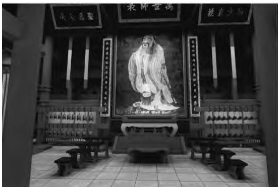
图6 大成殿中堂陈列（设计图）

在处理大成殿中堂内的孔子磨漆画像时，特地邀请了画作原作者前来，并在其指导下对磨漆画破损处进行了修补，对画面整体进行作新处理，与此同时，在设计孔子磨漆画像装饰边框时，摒弃了原有陈列设计中采用的“柔软”边条，代之以层次分明的刚性边条，它与两边的圆柱将产生刚柔对