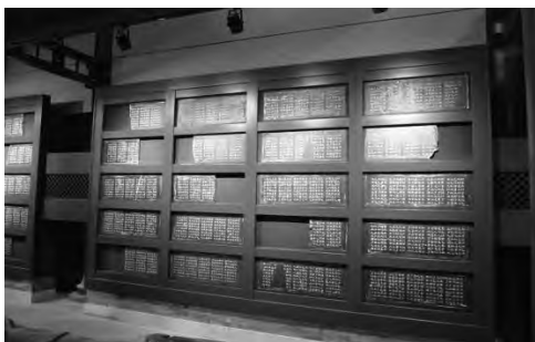
图1 现有大成殿孔子文化石刻陈列

为了能够让观众更方便欣赏这一陈列,在设计中对原有石刻进行了重新排序,在东北部墙面上陈列“图像碑刻”(包括《孔子七十二弟子像》《孔子事迹图》《孟子事迹图》),西北部墙面上陈列“石经碑刻”。除建筑安全以及美观考虑以外,为了更好地保护石碑,采取了以砖混架构为主的基础承重,底部为青砖装饰裙,石碑山墙周边均有实木制作的装饰架,除此以外东西两面石碑群山墙均采取了悬空防潮处理。