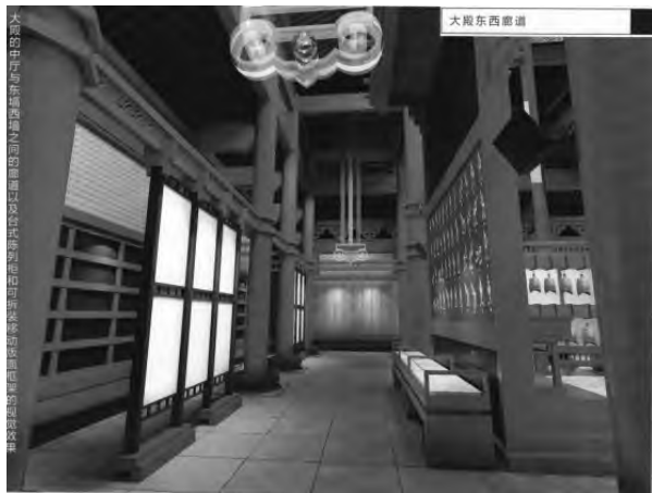
图5 展览廊道（设计图）